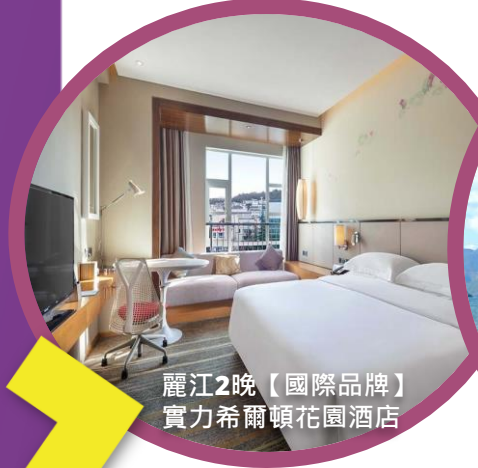
麗江2晚【國際品牌】實力希爾頓花園酒店

坐擁與希臘愛琴海灣一樣的地理地貌，緊鄰洱海，遠眺蒼山，在這裡體驗時間靜止般的午後，看海享受下午茶。