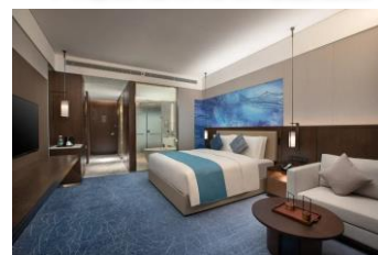
昆明滇中空港蔚景溫德姆酒店