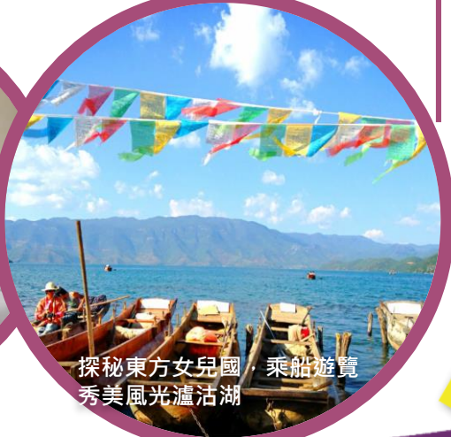
探秘東方女兒國，乘船遊覽秀美風光瀘沽湖