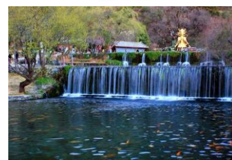
東巴文化聖地【玉水寨】